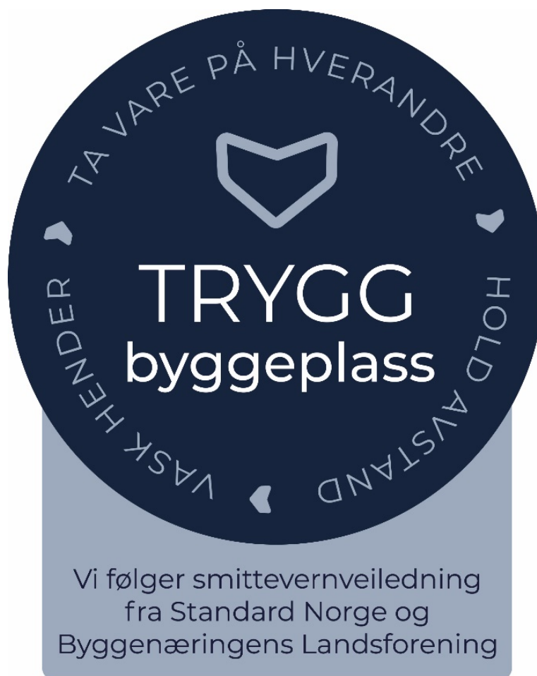
Figur 2 — Trygg byggeplass

Virksomheter som forplikter seg til å følge reglene og gjennomføre tiltakene i dette dokumentet, kan benytte emblemet vist på figur 2.